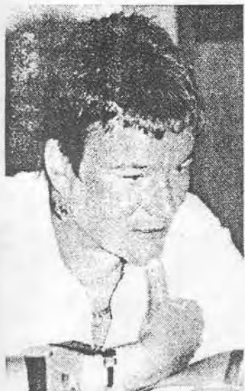
Mariella Mehr – zu Gast in Berlin. Die Autorin las dort aus ihren Büchern.

chirurgische Eingriffe. Seit 1975 schreibt Mariella Mehr. In verschiedenen Reportagen setzte sie sich für Außenseiter – „Zigeuner“, Kinder, Frauen, Frauenhäftlinge und Psychiatrie-Betroffene – ein. Mit Sachkenntnis und ungezügelter Energie nutzt sie ihre gewaltigen sprachlichen Mittel für die Opfer dieser Gesellschaft und gegen die Mächtigen, die diese Opfer fordern.